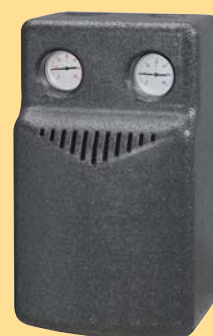
Kompaktverteiler KPV 25

Wärmeerzeuger werden allesamt vom WPM 2004 plus automatisch angesteuert. Ein programmierbares Lastmanagement für Heizung und Warmwasser ist auf die individuellen Bedürfnisse einstellbar und sorgt für hohen Wohlfühlkomfort bei gleichzeitiger Energieeinsparung.