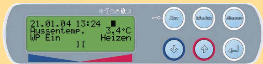
Alle relevanten Informationen Ihrer Wärmepumpenheizung auf einen Blick

Wärmeerzeuger werden allesamt vom WPM 2004 plus automatisch angesteuert. Ein programmierbares Lastmanagement für Heizung und Warmwasser ist auf die individuellen Bedürfnisse einstellbar und sorgt für hohen Wohlfühlkomfort bei gleichzeitiger Energieeinsparung.