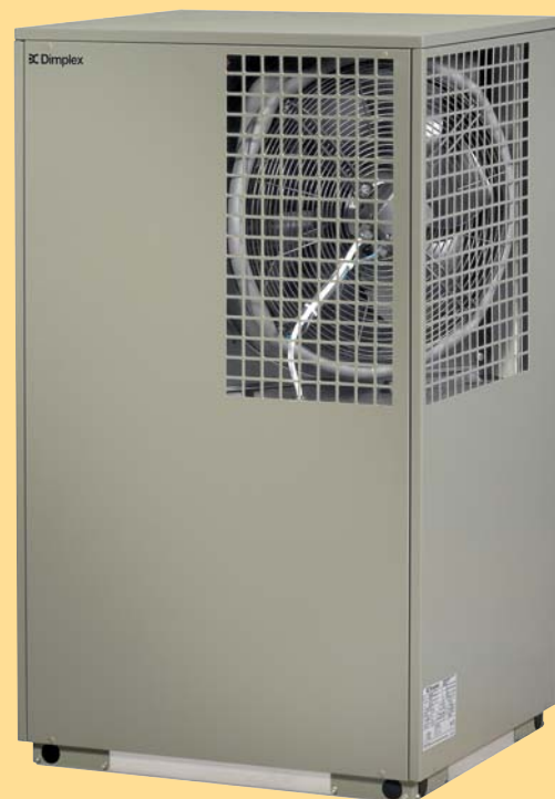
Luft/Wasser-Wärmepumpe LA 8AS

Im Dimplex Wärmepumpenmanager (WPM 2004 plus) ist ein Heizungsregler integriert, der die komplette Heizungs-Wärmepumpe in Abhängigkeit von der Außentemperatur regelt, steuert und überwacht. Wärmepumpe, Heizungs-, Warmwasserumwälzpumpe, Mischermotor und zweiter