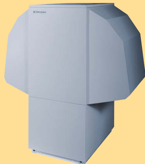
Luft/Wasser-Wärmepumpe LA 22PS

Mit dem Kombinationsspeicher PWS 332 ist der Platzbedarf im Haus minimal. Neben einem 100l-Speicher, der die Mindestlaufzeiten der Wärmepumpe sichert, ist auch ein 300l-Warmwasserspeicher integriert. In Verbindung mit der Dimplex Wärmepumpe LA 22PS sind Warmwassertemperaturen bis zu 60°C möglich.