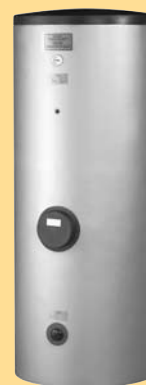
Kombinationsspeicher PWS 332